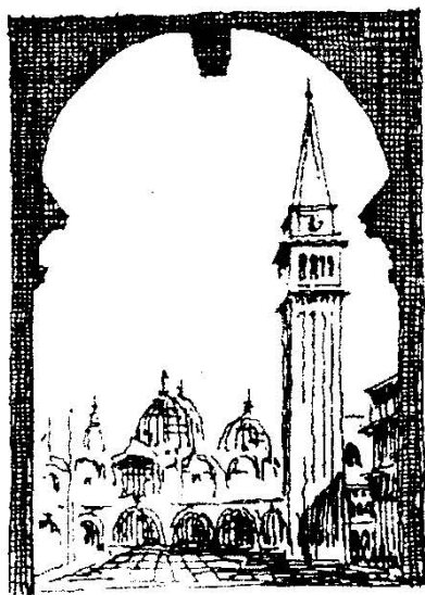
意大利威尼斯圣马可广场